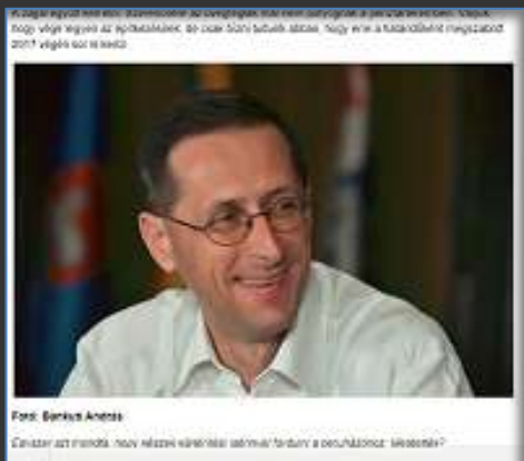
Varga Mihály, Nemzetgazdasági miniszter