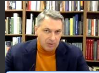
Lázár János, építési és beruházási miniszter