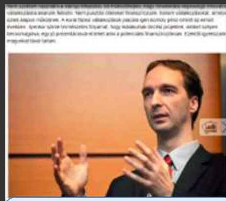
Oszkó Péter, volt pénzügyminiszter, befektető