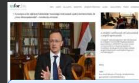
Szijjártó Péter külgazdasági miniszter